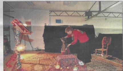
Actrice superbe et prenante

Un conte russe magique, féérique qui a plongé les spectateurs dans un univers fantasque et coloré. Babayaga est une fable universelle contée dans un décor chaleureux qui a fait voyager petits et grands dans les