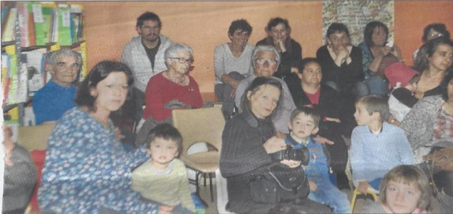
Adultes du logement foyer