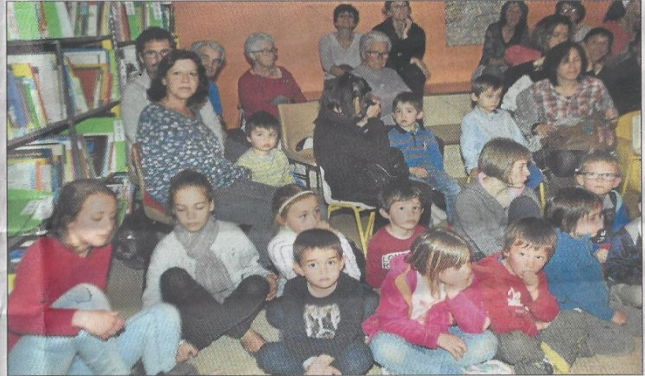
Enfants du centre de loisirs